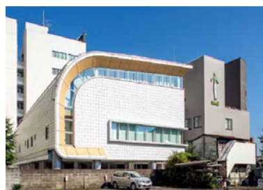
仙台レインボーハウス