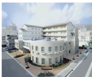
神戸レインボーハウス（東灘区）

収益金は震災&交通遺児支援施設「神戸レインボーハウス」（東灘区）、「東北レインボーハウス」、そして宮城県亘理郡山元町で行われている復興支援活動「黄色いハンカチプロジェクト」の維持管理を行っている「やまもと語りべの会」へ寄付します。