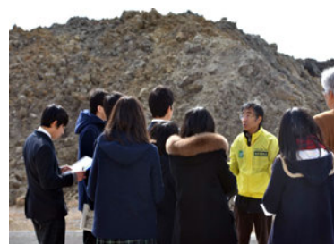
やまもと語りべの会